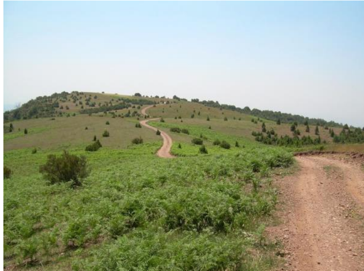
Figura 4. Zona estratégica del Parque Natural del Montseny (Catalunya).

lugar de invertir dinero cada 5-10 años en la reducción de la carga de combustible de un área determinada.