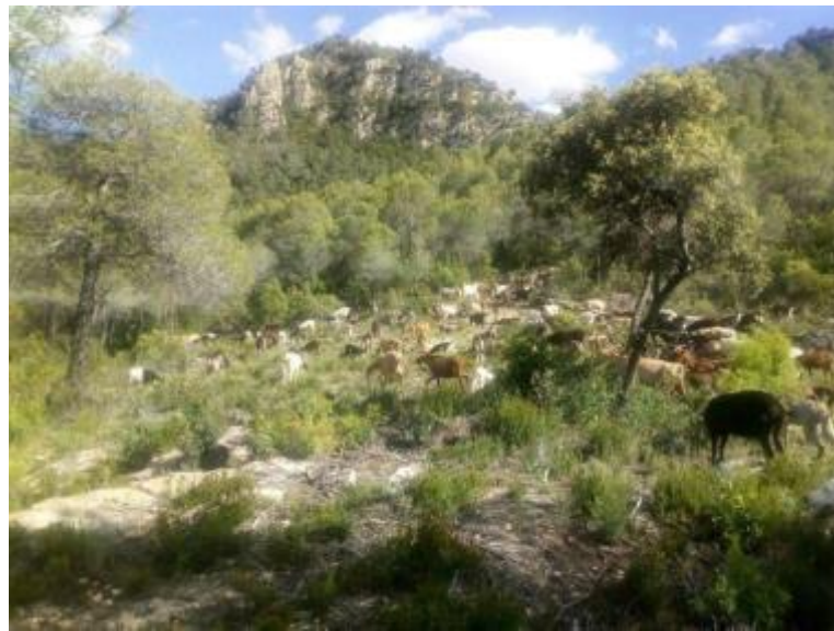
Figura 1. Pastoreo de zona estratégica en la Serra de Llaberia.

Las autorizaciones y acuerdos entre las partes interesadas son herramientas útiles que actualmente se están implementando positivamente. Sin embargo, una de las principales limitaciones que surgen de estos documentos es la vida útil. Los documentos legales deben renovarse año tras año, pero está claro que, desde la perspectiva del pastor, se necesita más tiempo para observar resultados significativos en términos de reducción de combustible y gestión del paisaje.