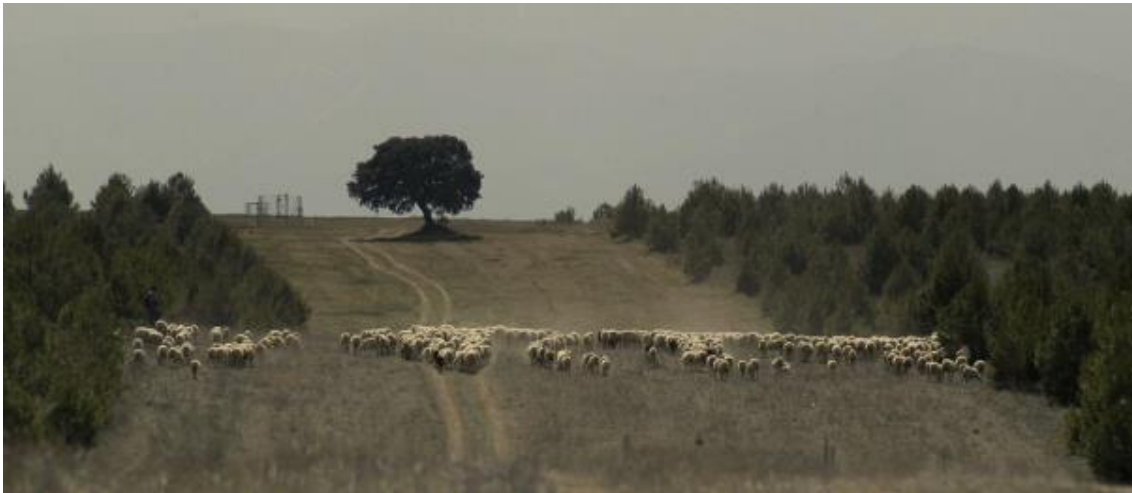
Figura 3. Cortafuego gestionado con pastoreo en Andalucía. Res de Áreas Pasto Cortafuego de Andalucía.

Teniendo en cuenta los recientes acontecimientos a los que han tenido que hacer frente algunos servicios de bomberos (Portugal octubre 2017, Ribera d'Ebre 2019, Cortes de Pallás 2012...), parece que las infraestructuras no lineales tienen que ganar protagonismo ya que los incendios provocados por el cambio climático tienen el potencial de hacer salto puntual a más de 5 km del frente. Por otro lado, el punto clave para limitar la capacidad de estos incendios será la reactivación de las actividades rurales (agricultura, ganadería extensiva, madera, etc.) que solían gestionar los bosques SUDOE. En otras palabras, se necesita un cambio diferente en el enfoque de gestión forestal de la administración pública, debemos ir hacia la preservación de las actividades rurales en